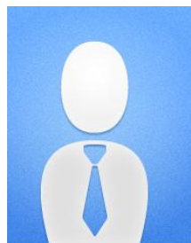
Guntars Mankuss (Saldus OK)